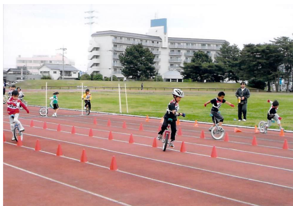
一輪車競技大会レース部門