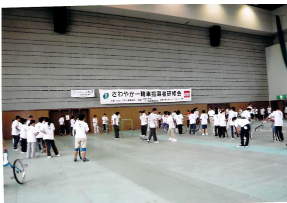
一輪車指導者研修会【鹿児島会場】