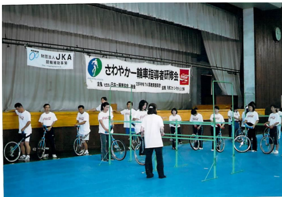
一輪車指導者研修会【千葉県会場】