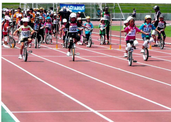
一輪車競技大会レース部門